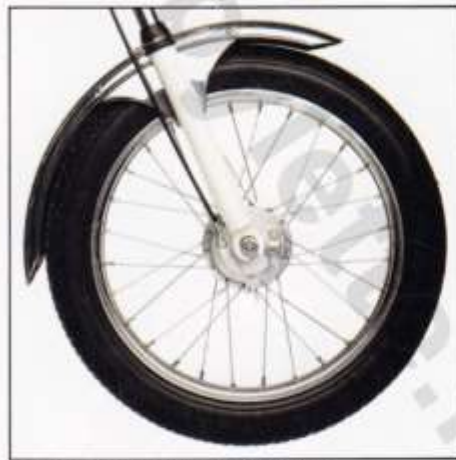
6. Fourche et garde-boue avant.