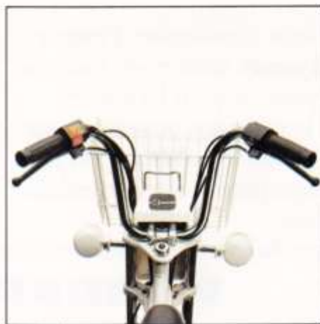
2. Guidon. Poignée.