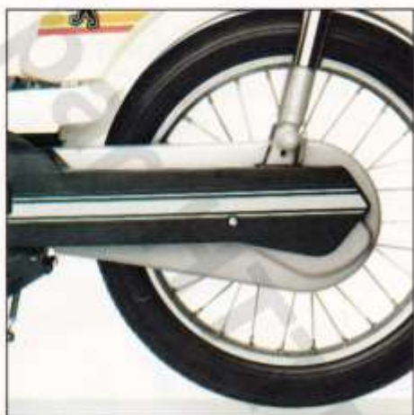
1. Mécanique protégée.

Cylindrée : 49 cm 3 . Puissance : 2,2 CH DIN. Moteur monté sur silentblocs. Aptitude en côte 12-14%. Protection intégrale de la transmission. Roues de 15 pouces. Pneumatiques 2.1/4 x 15. Fourche AV télescopique. Suspension AR. Freins AV et AR à tambour. Garde-boue AV inox. Marche-pieds avec coiffe plastique incassable sur plate-forme. Avertisseur électrique. Feu stop. Nouveau guidon, phare et fourche. Porte-bagages AV avec panier fourre-tout monté en série. Selle grand confort. Antivol intégré au tube de direction. Clignotants montés en série.