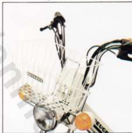
4. Panier. Phare. Clignotants AV.