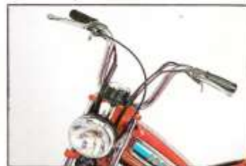
Guidon et phare.