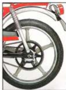
Suspension arrière et roues à bâtons.

Modèle "sport" de la gamme 103. Mêmes caractéristiques mécaniques que le 103 MVL - Roues de 17 pouces à bâtons avec moyeux en alliage léger - Fourche AV télescopique "sport" - Suspension AR avec ressorts à coulisseaux apparents - Freins AV et AR à tambour. (Se reporter au tableau page 15.)