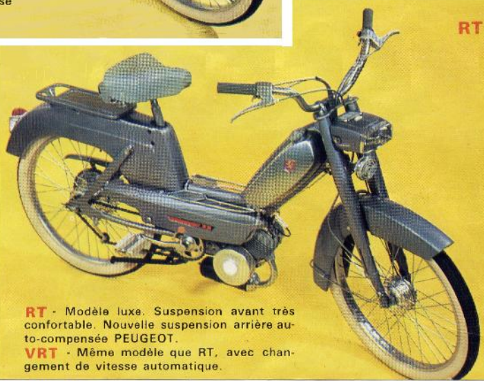
RT - Modèle luxe. Suspension avant très confortable. Nouvelle suspension arrière auto-compensée PEUGEOT.

Tous nos modèles sont équipés d'un double embrayage automatique. Vous freinez : vous vous arrêtez - Vous accélérez : vous repartez. Vitesse limitée à 50 km/h - Utilisation à partir de 14 ans et sans permis de conduire.