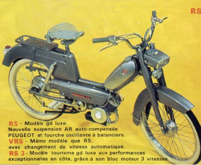
RS - Modèle gd luxe. Nouvelle suspension AR auto-compensée PEUGEOT et fourche oscillante à balanciers.