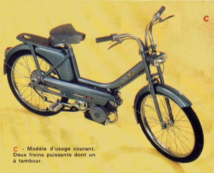
C - Modèle d'usage courant. Deux freins puissants dont un à tambour.