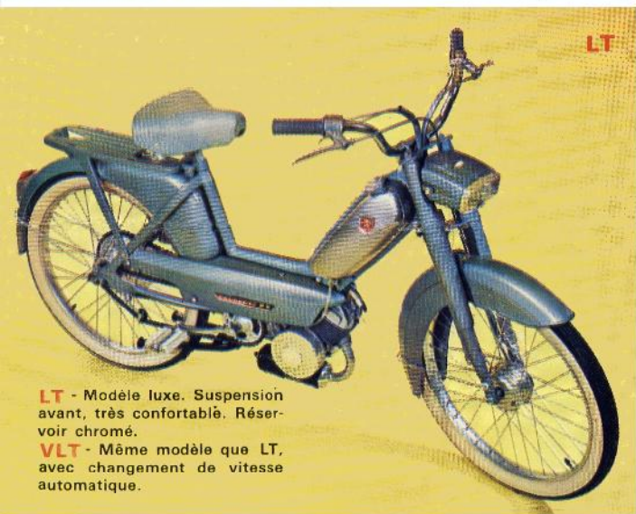
LT - Modèle luxe. Suspension avant, très confortable. Réservoir chromé.