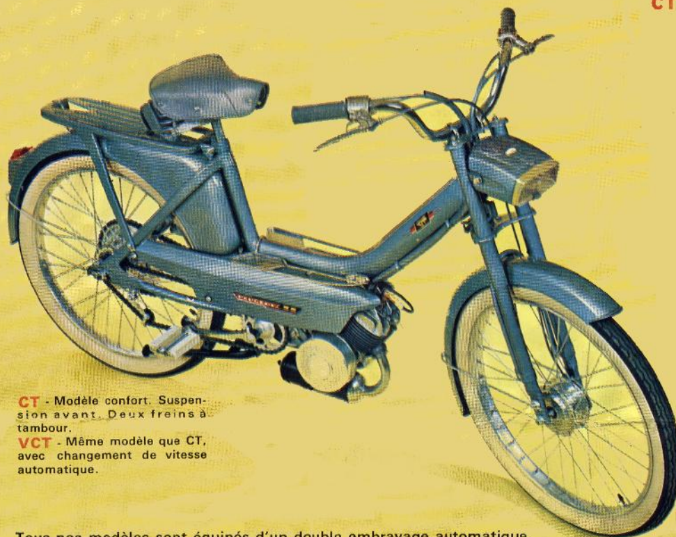
CT - Modèle confort. Suspension avant. Deux freins à tambour.