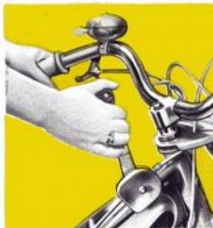
Commande de l'embrayage et du décompresseur synchronisés.