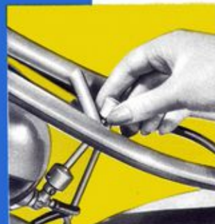
Rabot d'essence très accessible.