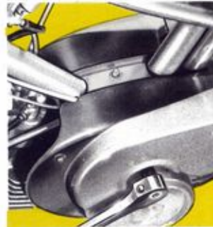
Capotage très efficace de l'ensemble mécanique.