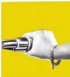
Commande des gaz et du décompresseur par poignée tournante.