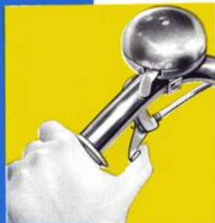
Starter commandé au guidon.

Bloc-moteur PEUGEOT 48 cc., 2 temps, à cylindre horizontal placé sous le pédalier. Transmission sous carter étanche. Capotage du moteur. Débrayage instantané du moteur par levier de basculement. Entraînement par galet sur roue AR, avec dispositif à pression constante. Silencieux Wilman. Commande des gaz et décompresseur par poignée tournante. Starter par commande au guidon. Réservoir 2,5 litres. Cadre berceau hauteur 48 cm. Tubes renforcés. Jantes acier chromé 600 B à rayons renforcés. Pare-chaîne. Pneus spéciaux renforcés 600 x 50 B. Freins AV. et AR, cantilever. Porte-bagages AR. Selle poids lourd. Sacoche de selle. Guidon relevé acier chromé. Timbre avertisseur. Éclairage sur volant magnétique. Garde-boue enveloppants. Pédales acier à flasques rabattues. Chaîne Yellowox 3,17. Tendeur de chaîne. Pompe. Outillage. Émail : Mastic.